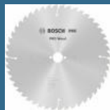
BOSCH Disc Optiline Wood 315x30x48T