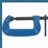
CROMWELL Clama in G 12" EXTRA HEAVY DUTY "G"CLAMP