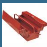
CROMWELL Cutie a extensibila pentru scule 17" 5 TRAY CANTILEVER TOOL BOX