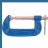
CROMWELL Clama de Uz Extra Intens - Surub Placat cu Cupru 10" EXTRA HEAVY DUTY "G"CLAMP WITH COPPER SCREW