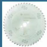
BOSCH Disc Top Precision Best for Wood 315x30x48T