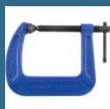
CROMWELL Clama cu Gatul Adanc 4" HEAVY DUTY "G" CLAMP - DEEP THROAT