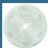
BOSCH Disc Top Precision Best for Wood 315x30x72T