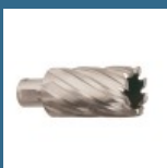
MAKITA Burghiu inelar scurt 18x25 mm pentru HB500