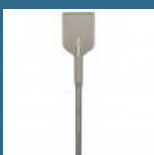
BOSCH Delta pentru asfalt SDS-MAX