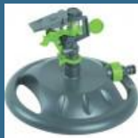
CROMWELL Stropitor cu impulsuri PLASTIC IMPULSE SPRAYER