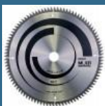
BOSCH Disc Multimaterial 305x30x96T