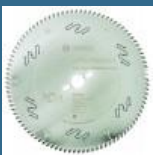
BOSCH Disc Top Precision Best for Laminated Panel Abrasive 300x30x96T