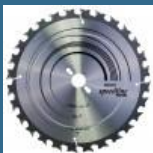
BOSCH Dis Speedline Wood 300x30x28T