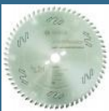
BOSCH Disc Top Precision Best for Laminated Panel Abraziv 303x30x60T