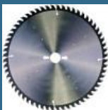
BOSCH Disc Optiline Wood 305x30x60T