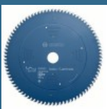
BOSCH Disc Best for Laminate 305x30x96T