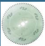
BOSCH Disc Top Precision Best for Wood 300x30x72T