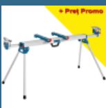
BOSCH GTA 3800 Masa de lucru