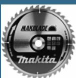
MAKITA Disc circular lemn 305x30x48T