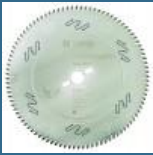
BOSCH Disc Top Precision Best for Wood 300x30x96T