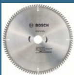
BOSCH Disc Eco for Aluminium 305x30x96T