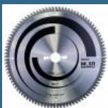
BOSCH Disc Multimaterial 300x30x96T