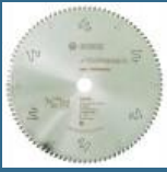
BOSCH Disc Top Precision Multimaterial 305x30x96T