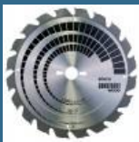
BOSCH Disc Construct Wood 300x30x20T