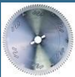
BOSCH Disc Top Precision Best for Laminated Panel Fine 300x30x96T