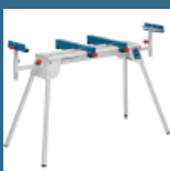
BOSCH GTA 2600 Masa de lucru