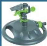
CROMWELL Stropitor cu impulsuri PLASTIC IMPULSE SPRAYER