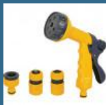
CROMWELL Set de pistoale de pulverizare SPRAY GUN SET 4 piese