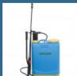
CROMWELL Pulverizator manual 16 Ltr KNAPSACK SPRAYER