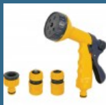
CROMWELL Set de pistoale de pulverizare SPRAY GUN SET 4 piese