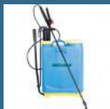
CROMWELL Pulverizator manual 16 Ltr KNAPSACK SPRAYER