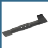
BOSCH Cutit de schimb pentru Rotak 37