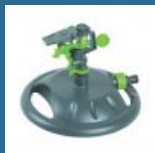
CROMWELL Stropitor cu impulsuri PLASTIC IMPULSE SPRAYER