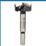
BOSCH Burghiu balamale 35 mm HM (pentru PAL melaminat)