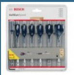
BOSCH Set 6 burghie plate Selfcut Speed 16/18/20/22/25/32 mm + Prelungitor