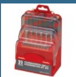
MAKITA Set 21 de accesorii mixte