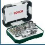
BOSCH Caseta 26 biti