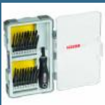
BOSCH Caseta 36 biti speciali + maner