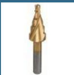
BOSCH Burghiu in 5 trepte HSS-TiN 4-12 mm