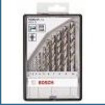
BOSCH Caseta 10 burghie metal HSS-G 1-10 mm