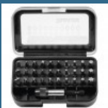
MAKITA Caseta 31 biti + adaptor