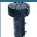
BOSCH Ascutitor burghie metal S41