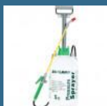
CROMWELL Pulverizator maual 5 Ltr PRESSURE SPRAYER