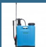
CROMWELL Pulverizator manual 20 Ltr KNAPSACK PROFESSIONAL SPRAYER