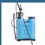
CROMWELL Pulverizator maual 20 Ltr KNAPSACK PROFESSIONAL SPRAYER