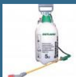
CROMWELL Pulverizator maual 5 Ltr PRESSURE SPRAYER