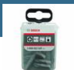
BOSCH Set 25 biti Extra Hard 25 mm, PZ2 in cutie Tic-Tac