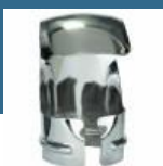
BOSCH Duza reflectoare pentru GHG, PHG