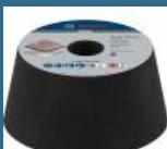
BOSCH Piatra oala pentru piatra 110 mm, R36