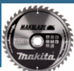
MAKITA Disc circular lemn 260x30x40T