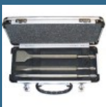
MAKITA Set 3 dalti SDS-PLUS