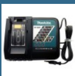
MAKITA Incarcator Rapid Li-Ion, 14.4-18V, DC18RC