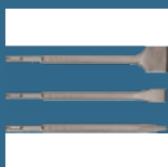
BOSCH Set 3 dalti SDS-PLUS