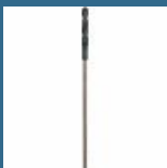
BOSCH Burghiu cofraj SDS-PLUS 16x400 mm