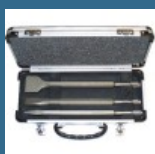
MAKITA Set 3 dalti SDS-PLUS