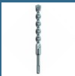
MAKITA Burghiu SDS-PLUS V-PLUS 10x160 mm