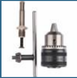
BOSCH Mandrina cu cheie 1.5-13 mm cu adaptor SDS-PLUS