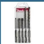
MAKITA Set 5 burghie SDS-PLUS 5/6/6/8/8 mm