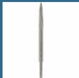
BOSCH Spitz cu auto ascutire 250 mm SDS-PLUS