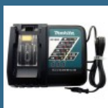
MAKITA Incarcator Rapid Li-Ion, 14.4-18V, DC18RC