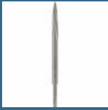
BOSCH Spitz cu auto ascutire 250 mm SDS-PLUS