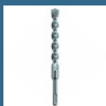
MAKITA Burghiu SDS-PLUS V-PLUS 10x160 mm