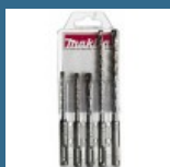
MAKITA Set 5 burghie SDS-PLUS 5/6/6/8/8 mm