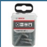
BOSCH Set 25 biti Extra Hard 25 mm, PZ2 in cutie Tic-Tac