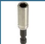
BOSCH Adaptor magnetic 55 mm