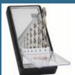
BOSCH Caseta 6 burghie metal HSS-G 2-8 mm