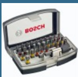
BOSCH Caseta 31 biti + adaptor