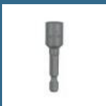
BOSCH CHEIE HEXAGONALA 8