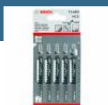
BOSCH T144D Set 5 panze Speed for Wood 100 mm