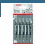
BOSCH T144D Set 5 panze Speed for Wood 100 mm