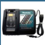
MAKITA Incarcator Rapid Li-Ion, 14.4-18V, DC18RC