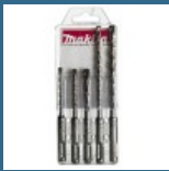
MAKITA Set 5 burghie SDS-PLUS 5/6/6/8/8 mm