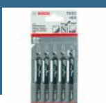
BOSCH T111C Set 5 panze Basic for Wood 100 mm