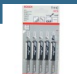
BOSCH T144C Set 5 pinze Recip for Wood 140 mm