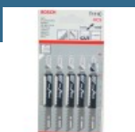
BOSCH T144C Set 5 pinze Recip for Wood 140 mm