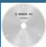
BOSCH Disc Optiline Wood 254x30x60T