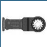
BOSCH AIZ32APB Panza BIM Wood and Metal 32x50 mm STARLOCK