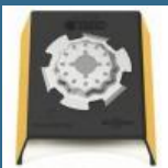
BOSCH AUZ70G Placa pentru profile 70x55 mm STARLOCK