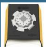
BOSCH AUZ70G Placa pentru profile 70x55 mm STARLOCK