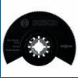
BOSCH ACZ85EC Panza HCS Wood 85 mm STARLOCK