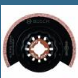
BOSCH ACZ70RT5 Panza Grout and Abrasive HM-RIFF 70 mm STARLOCK