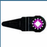
BOSCH AIZ28SC Panza HCS Universal 28x50 mm STARLOCK