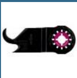
BOSCH ASZ32SC Cutit HCS Multimaterial 24x11 mm STARLOCK