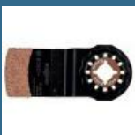
BOSCH AIZ32RT5 Panza Grout and Abrasive HM-RIFF 32x30 mm, R50 STARLOCK