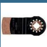
BOSCH AIZ32RT5 Panza Grout and Abrasive HM-RIFF 32x30 mm, R50 STARLOCK