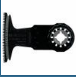
BOSCH AII65BSPC Panza HCS Hard Wood 65x40 mm STARLOCK