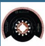
BOSCH ACZ70RT5 Panza Grout and Abrasive HM-RIFF 70 mm STARLOCK