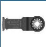
BOSCH AIZ32BB Panza BIM Hard Wood 32x50 mm STARLOCK