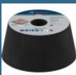
BOSCH Piatra oala pentru piatra 110 mm, R36