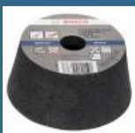
BOSCH Piatra oala pentru piatra 110 mm, R36