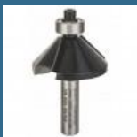
BOSCH Freza de fatetat 8x11x15x56 45° HM