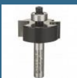
BOSCH Freza de faltuit 8x9.5x12.7x54 HM