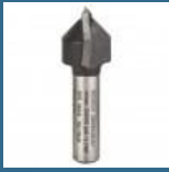
BOSCH Freza caneluri V 8x16x16x45 90° HM