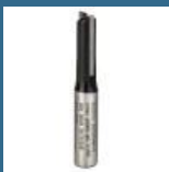
BOSCH Freza caneluri 8x8 HM (Hobby line)