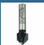
BOSCH Freza de profilat H 8x12.7x12.7x46 R2.4 HM