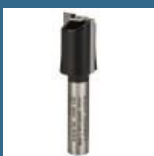
BOSCH Freza caneluri 8x16 HM (Hobby line)