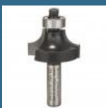
BOSCH Freza de rotunjit 8x15.5x53 R8 HM