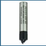
BOSCH Freza sfert de tort 8x9.5x10.5x41 R3.2 HM