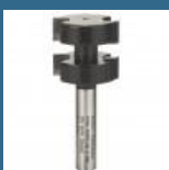
BOSCH Freza feder 8x25x5x58 HM