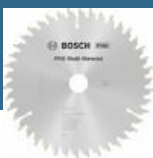
BOSCH Disc Multimaterial 160x20/16x42T