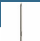
BOSCH Spitz 520 mm (prindere 28 mm)