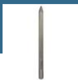
BOSCH Spitz 520 mm (prindere 28 mm)