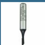
BOSCH Freza caneluri 8x3x8x51 HM