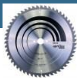
BOSCH Disc Optiline Wood 350x30x54T