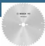
BOSCH Disc Optiline Wood 350x30x54T