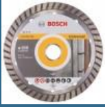
BOSCH Disc diamantat universal 150 PROFESSIONAL TURBO