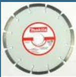
MAKITA Disc diamantat 150 mm