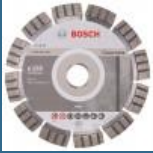
BOSCH Disc diamantat beton 150 BEST