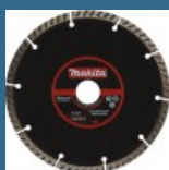
MAKITA Disc diamantat 150 mm