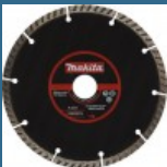
MAKITA Disc diamantat 150 mm