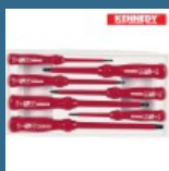
CROMWELL Set surubelite izolate VDE 1000V SET 7 piese