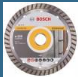
BOSCH Disc diamantat universal 150 PROFESSIONAL TURBO