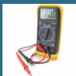
CROMWELL Multimetru digital - DM664 DM664 DIGITAL MULTIMETER