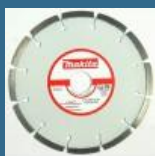
MAKITA Disc diamantat 150 mm