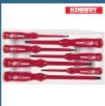
CROMWELL Set surubelite izolate VDE 1000V SET 7 piese