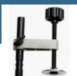
MAKITA Strangator vertical pentru LH1040