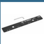
BOSCH FSN VEL Element imbinare sine de ghidare