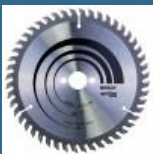
BOSCH Disc Optiline Wood 160x20/16x48T