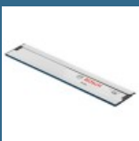
BOSCH FSN 800 Sina de ghidare 0.8 m