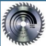
BOSCH Disc Optiline Wood 160x20/16x36T