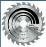
BOSCH Disc Optiline Wood 160x20/16x24T