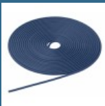
BOSCH FSN HB Banda adeziva pentru sine de ghidare