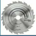
BOSCH Disc Speedline Wood 160x20x18T