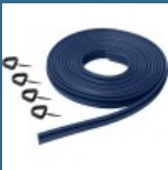
BOSCH FSN SS Banda adeziva pentru sine de ghidare