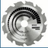
BOSCH Disc Construct Wood 160x20/16x12T