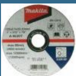
MAKITA Set 10 discuri taiere otel 125x2.5 mm