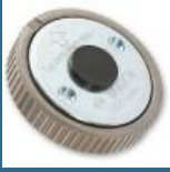
BOSCH Piulita SDS CLICK