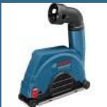
BOSCH GDE 115/125 FC-T Sanie de ghidare 115/125 mm