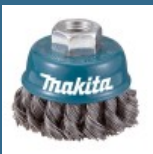
MAKITA Perie sarma 60x0.5 mm