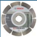
BOSCH Set 10 discuri diamantate beton 125 PROFESSIONAL