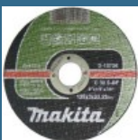
MAKITA Set 10 discuri taiere piatra 125x3 mm