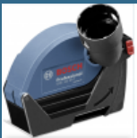
BOSCH GDE 125 EA-T Sanie de ghidare 125 mm