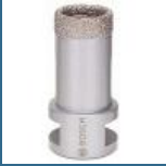
BOSCH Carota diamantata Dry Speed 25 mm