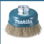
MAKITA Perie sarma 75x0.3 mm