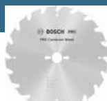
BOSCH Disc Construit Wood 305x30x20T