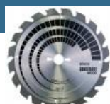
BOSCH Disc Construit Wood 305x30x20T