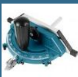
MAKITA Limitator unghiular pentru LB1200F