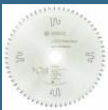
BOSCH Disc Top Precision Multimaterial 216x30x64T