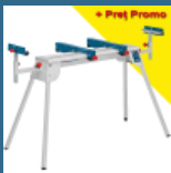
BOSCH GTA 2600 Masa de lucru