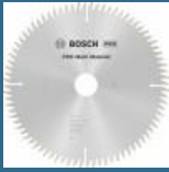
BOSCH Disc Multimaterial 216x30x80T