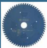
BOSCH Disc Best for Laminate 216x30x60T