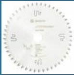
BOSCH Disc Top Precision Best for Wood 216x30x48T