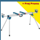
BOSCH GTA 3800 Masa de lucru