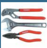
CROMWELL Set Clesti Crom Vanadiu de Calitate din 3 Piese 200 mm CV PLIER & WRENCH SET 3 piese