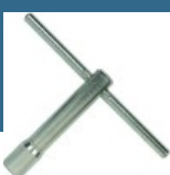
MAKITA Cheie tubulara pentru 2012NB