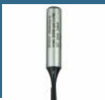
BOSCH Freza caneluri 8x3x8x51 HM