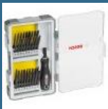
BOSCH Caseta 36 biti speciali + maner