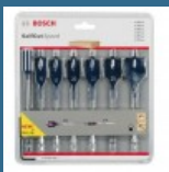
BOSCH Set 6 burghie plate Selfcut Speed 16/18/20/22/25/32 mm + Prelungitor