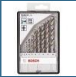
BOSCH Caseta 10 burghie metal HSS-G 1-10 mm