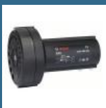
BOSCH Ascutitor burghie metal S41