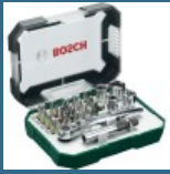
BOSCH Caseta 26 biti