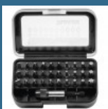
MAKITA Caseta 31 biti + adaptor