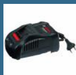
BOSCH GAL1880CV Incarcator rapid Li-Ion de 8Ah, 18V