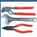
CROMWELL Set Clesti Crom Vanadiu de Calitate din 3 Piese 200 mm CV PLIER & WRENCH SET 3 piese