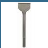
BOSCH Dalta lata 300x80 mm SDS-MAX