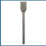
BOSCH Dalta 350x50 mm SDS-MAX