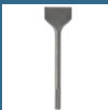
BOSCH Dalta pentru faianta 300x80 mm SDS-MAX