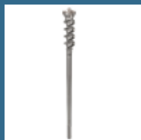
BOSCH Burghiu strapungere 55x450x600 mm