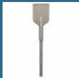
BOSCH Delta pentru asfalt SDS-MAX