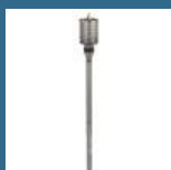
BOSCH Carota SDS-MAX 68x420x550 mm