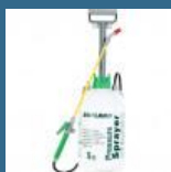
CROMWELL Pulverizator maual 5 Ltr PRESSURE SPRAYER