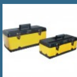
CROMWELL Cutie de scule de mare rezistenta 470 mm & 582 mm YELLOW METAL TOOLBOX SET 2 piese