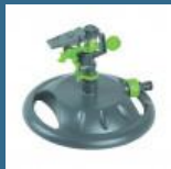
CROMWELL Stropitor cu impulsuri PLASTIC IMPULSE SPRAYER