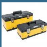
CROMWELL Cutie de scule de mare rezistenta 470 mm & 582 mm YELLOW METAL TOOLBOX SET 2 piese