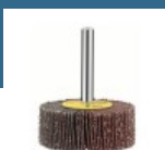
BOSCH Slefuitor lamelar 50 mm, R120