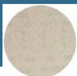
BOSCH Pasla lustruit 125 mm, moale