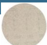
BOSCH Disc de slefuire 125 mm - meala