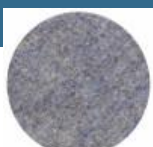
BOSCH Disc de slefuire 125 mm - meala