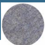
BOSCH Pasla lustruit 125 mm, moale