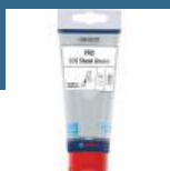
BOSCH Tub vaselina pentru accesorii SDS 100 ml