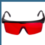
BOSCH Ochelari pentru laser rosu