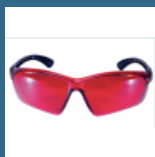
ADA VISOR RED Ochelari pentru laser rosu