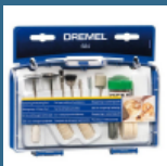
DREMEL Set curatare/lustruire (684)