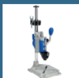
DREMEL Statie de lucru (220)