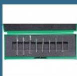
CROMWELL Set freze de viteza mare SPEEDWAY DUALCUT CARBIDEBURR SET 3 mm SHANK 8 piese