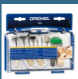
DREMEL Set curatare/lustruire (684)