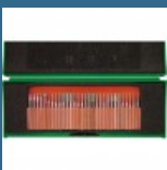
CROMWELL Set de burghie diamantate DIAMOND COATED BURR SET3 mm SHANK (30 piese)