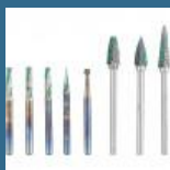
CROMWELL Set freze de viteza mare SPEEDWAY DUALCUT CARBIDEBURR SET 3 mm SHANK 8 piese