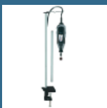
DREMEL Suport cu ax flexibil (2222)