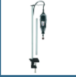
DREMEL Suport cu ax flexibil (2222)