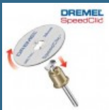
DREMEL Set de baza EZ SpeedClic (SC406)