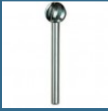
DREMEL Taietor de mare viteza 7,8 mm (114)