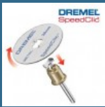
DREMEL Set de baza EZ SpeedClic (SC406)