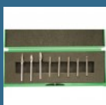
CROMWELL Set de freze Carbide 8 piese DOUBLE CUT BURR SETCUT 6 3 mm SHK