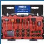
CROMWELL Set de accesorii cu unelte multiple MULTI-TOOL ACCESSORY KIT53PC