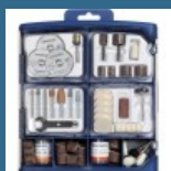
DREMEL Set de accesorii multifunctionale 150 piese (724)