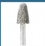
DREMEL Disc de taiere de carbura de wolfram 7,8 mm (9934)