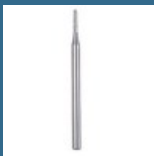
DREMEL Bit de indepartare rosturi 1,6 mm (569)