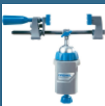
DREMEL Multi-Vise menghina 3 in 1 (2500)