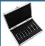
CROMWELL Set de freze Carbide 8 piese DOUBLE CUT BURR SETCUT 6 3 mm SHK