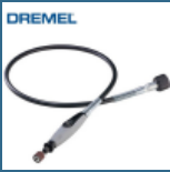
DREMEL Ax flexibil (225)