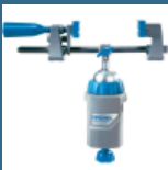
DREMEL Multi-Vise menghina 3 in 1 (2500)