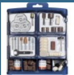
DREMEL Set de accesorii multifunctionale 150 piese (724)