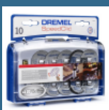
DREMEL Set de accesorii EZ SpeedClic (SC690)