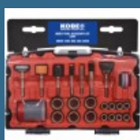
CROMWELL Set de accesorii cu unelte multiple MULTI-TOOL ACCESSORY KIT53PC