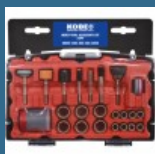
CROMWELL Set de accesorii cu unelte multiple MULTI-TOOL ACCESSORY KIT53PC