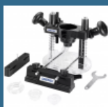
DREMEL Dispozitiv de rectificare-frezare (335)