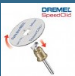
DREMEL Set de baza EZ SpeedClic (SC406)