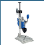
DREMEL Statie de lucru (220)