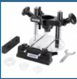
DREMEL Dispozitiv de rectificare-frezare (335)