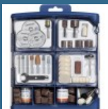
DREMEL Set de accesorii multifunctionale 150 piese (724)