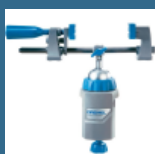
DREMEL Multi-Vise menghina 3 in 1 (2500)