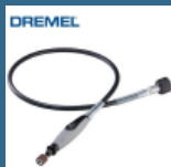
DREMEL Ax flexibil (225)