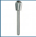
DREMEL Taietor de mare viteza 7,2 mm (134)