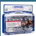
DREMEL Set de accesorii EZ SpeedClic (SC690)