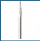
DREMEL Bit cu varf diamantat 2,0 mm (7134)