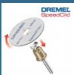
DREMEL Set de baza EZ SpeedClic (SC406)