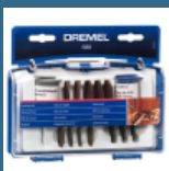
DREMEL Set de taiere (688)