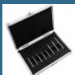
CROMWELL Set de freze Carbide 8 piese DOUBLE CUT BURR SETCUT 6 3 mm SHK