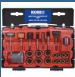
CROMWELL Set de accesorii cu unelte multiple MULTI-TOOL ACCESSORY KIT53PC