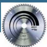
BOSCH Disc Optiline Wood 254x30x60T