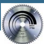
BOSCH Disc Optiline Wood 254x30x60T